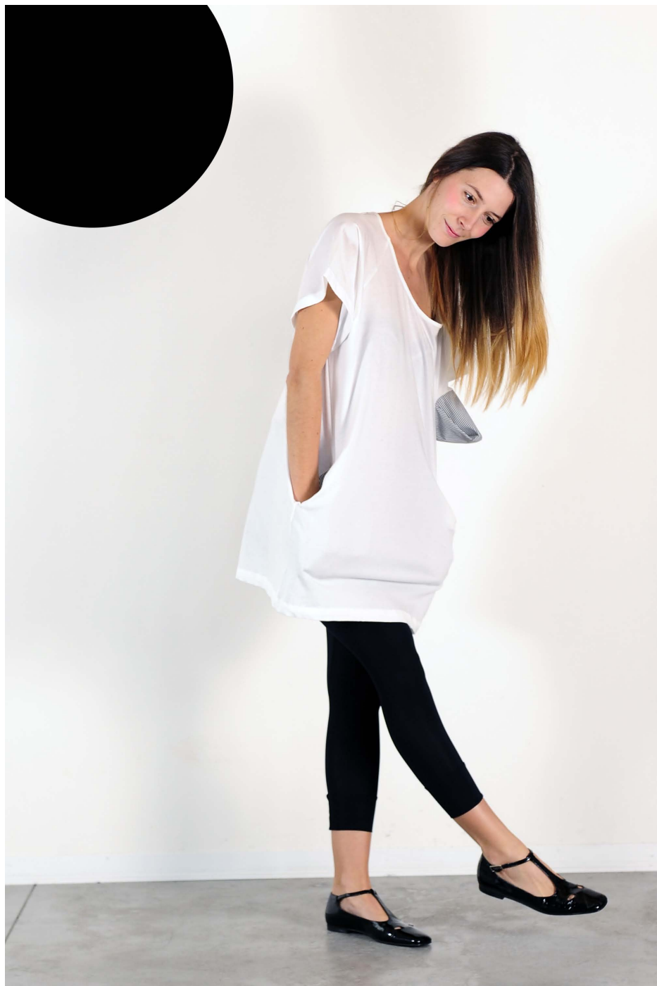
Art. 1706 - t-shirt con tasche • Art. 1720 - pantacollant