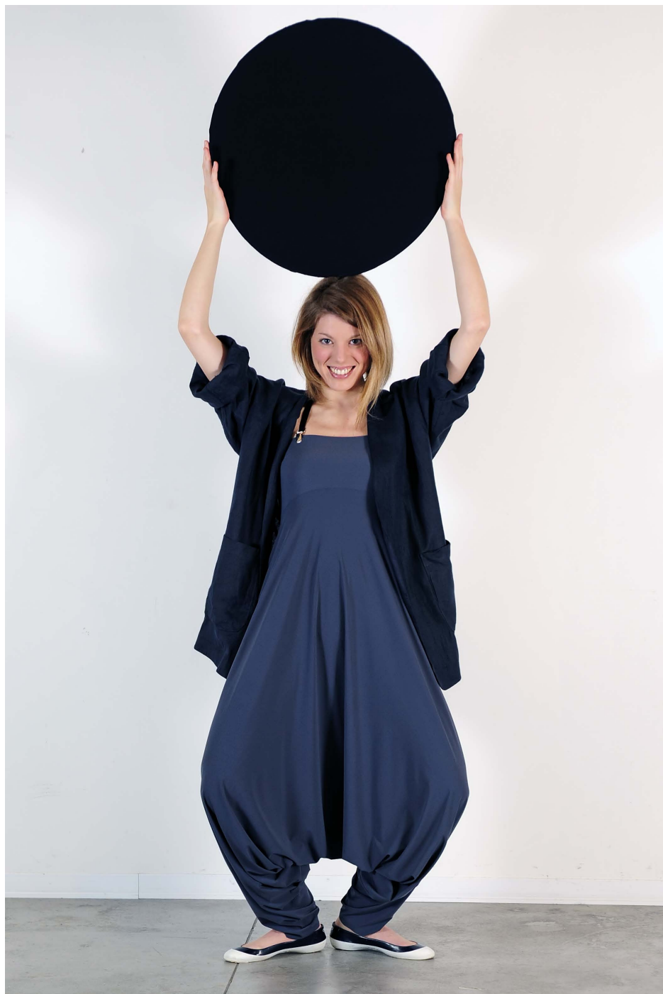
Art. 1708 - giacca • Art. 1716 - panta-tuta trasformista