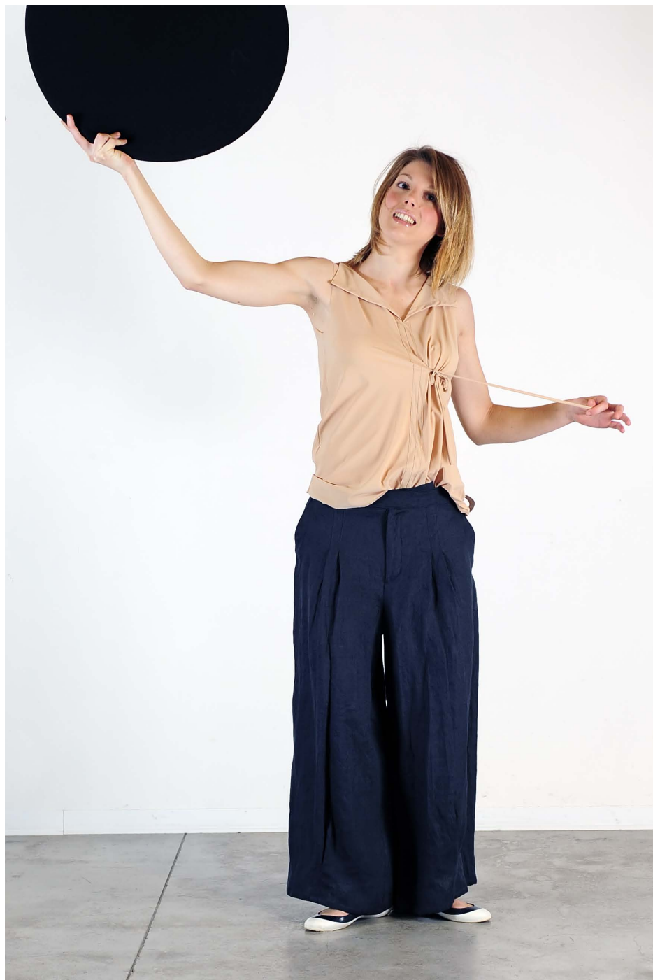
Art. 1719 - camicia canotta • Art. 1705 - pantalone pieghe largo