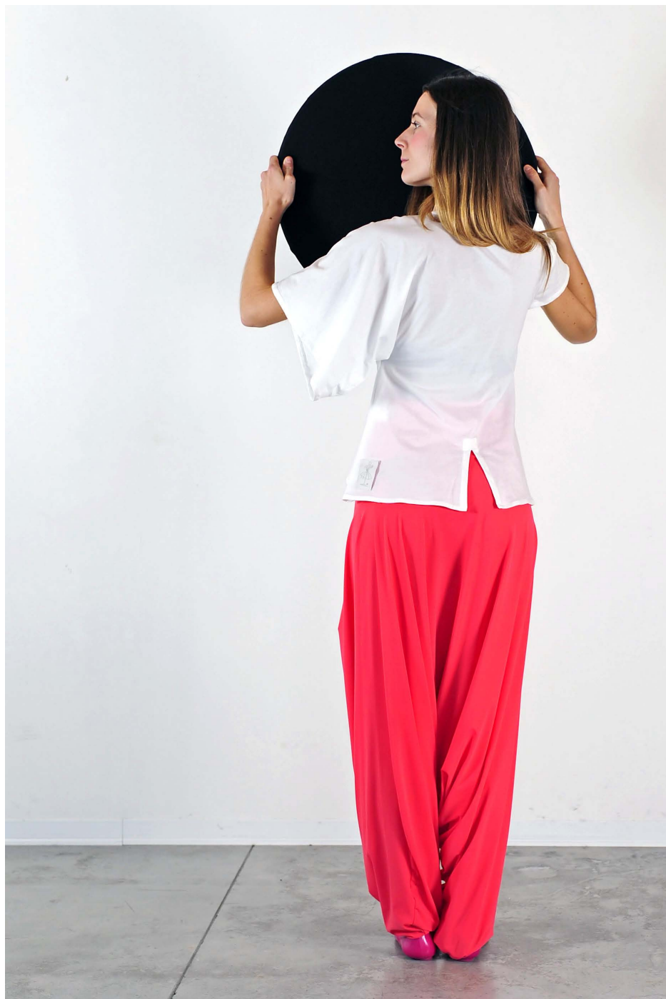
Art. 1714 - maglia maniche diverse • Art. 1716 - panta-tuta trasformista