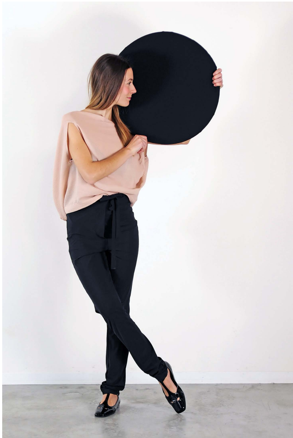
Art. 1707 - camicia cerchio • Art. 1721 - pantalone laccio