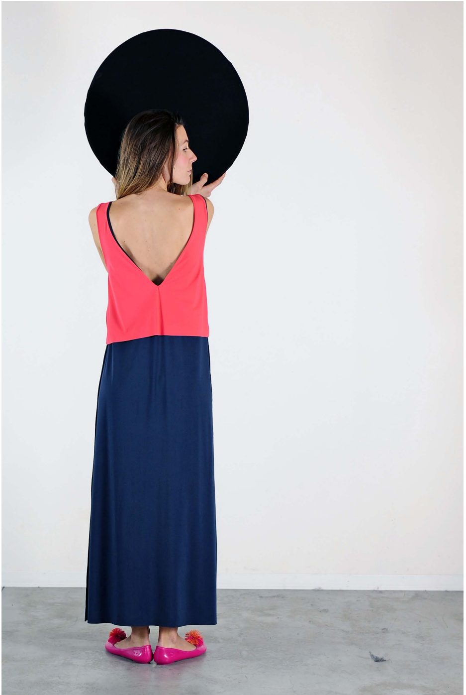
Art. 1717 - abito lungo trasformista