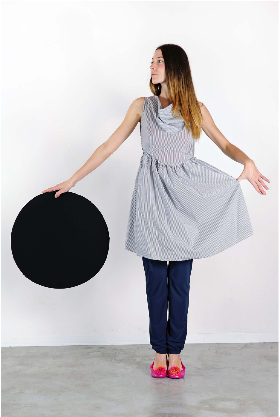
Art. 1712 - abito goccia • Art. 1721 - pantalone laccio