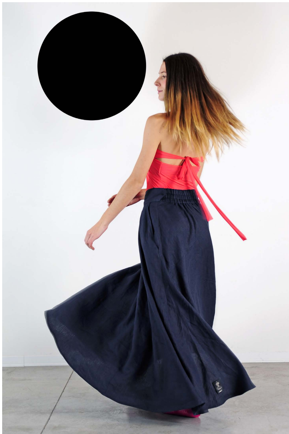
Art. 1715 - abito top trasformista • Art. 1702 - gonna lunga