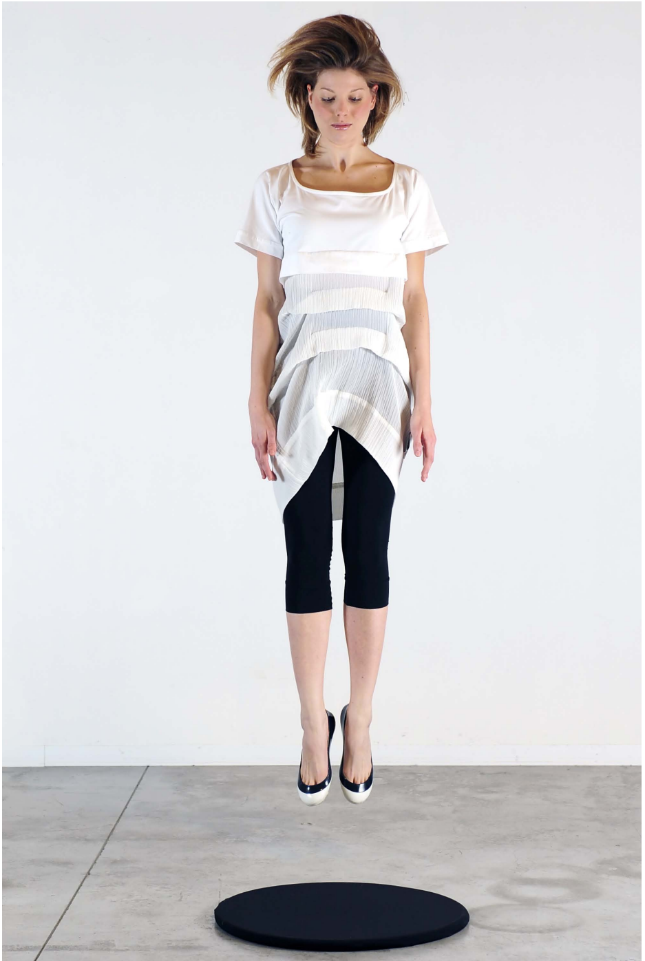
Art. 1711 - t-shirt maxi pieghe • Art. 1720 - pantacollant