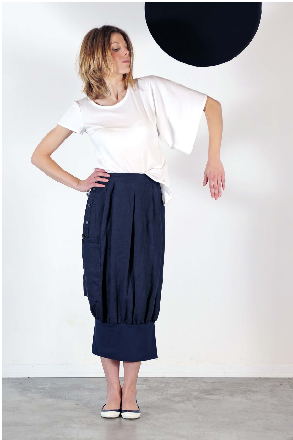
Art. 1713 - abito gonna bottoncini trasformista