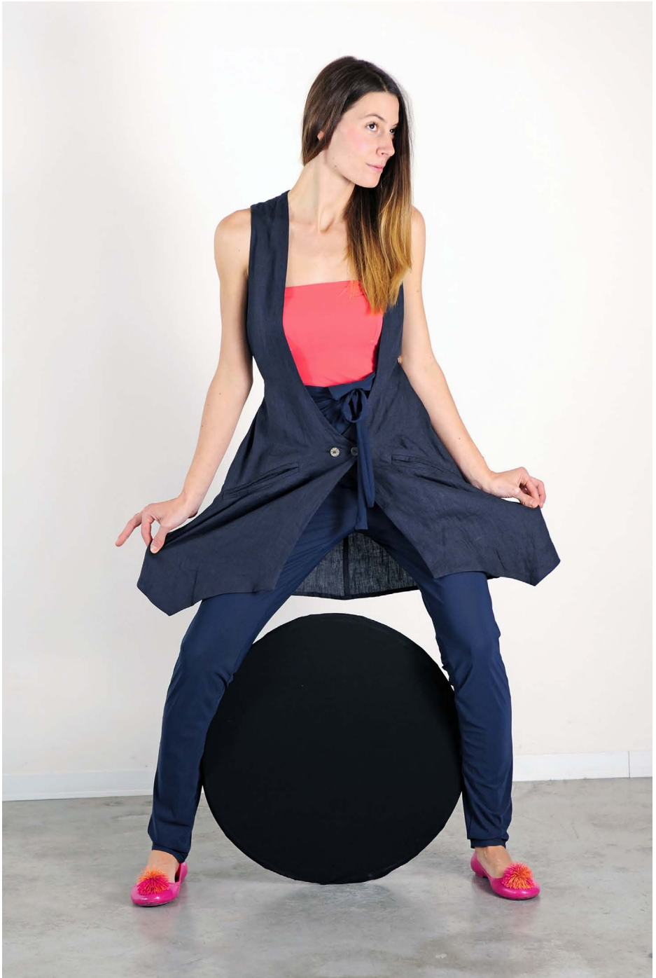
Art. 1709 - body fascia • Art. 1721 - pantalone laccio • Art.1703 - maxigilet