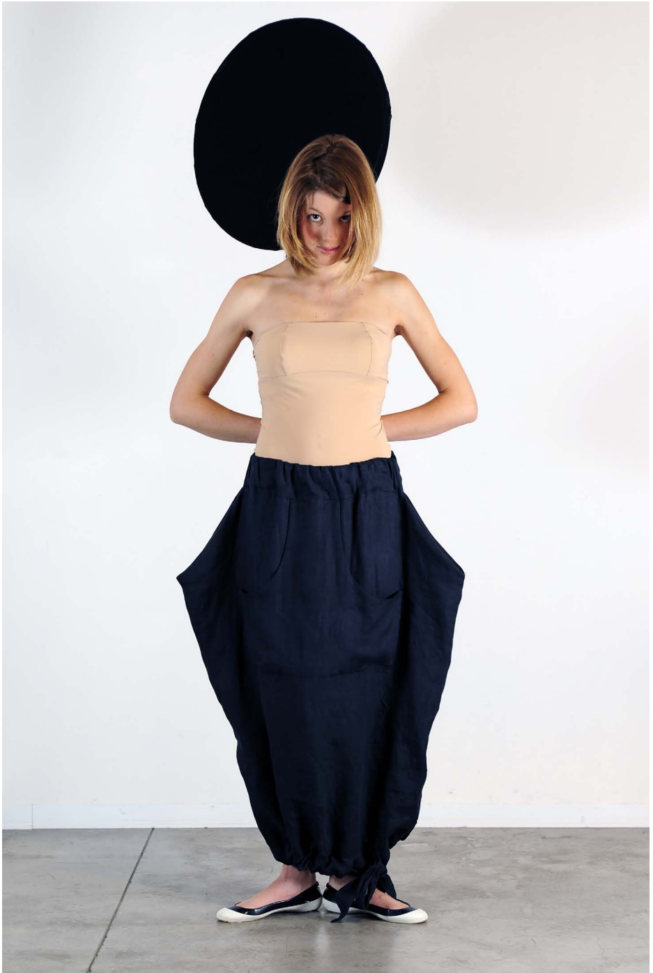
Art. 1704 - maxi maglia fiocco trasformista • Art. 1709 - body fascia