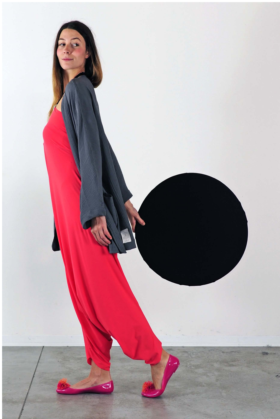
Art. 1708 - giacca • Art. 1716 - panta-tuta trasformista