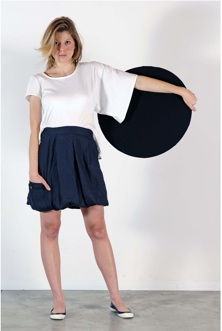
Art. 1714 - maglia maniche diverse