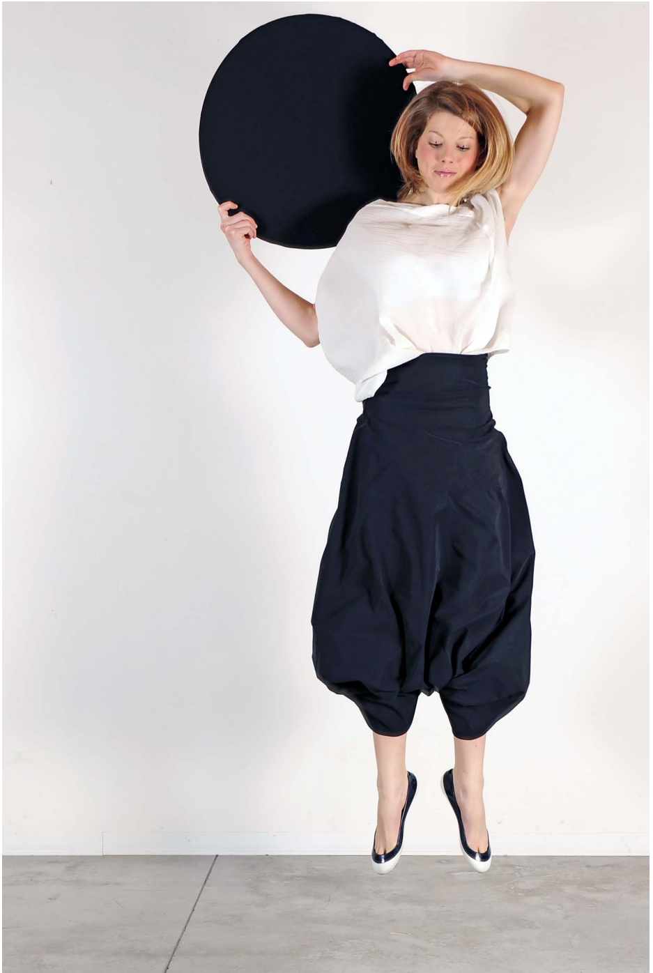
Art. 1707 - camicia cerchio • Art. 1716 - panta-tuta trasformista