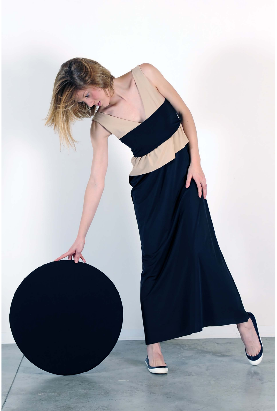
Art. 1717 - abito lungo trasformista