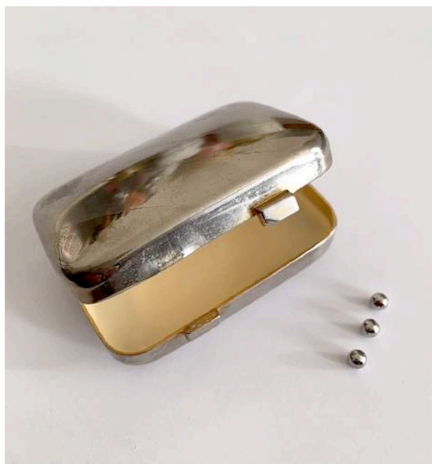
I puntini di Louis-Ferdinand Céline

(Il brano è tratto da Louis-Ferdinand Céline, Morte a credito , traduzione di Giorgio Caproni, Tea 1997, p. 99.)