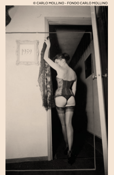
EXPOSED Torino Photo Festival. Carlo Mollino, «Ritratto di Evi, studio per biglietto d'auguri di fine anno», 1959. Dal 9 aprile al 2 giugno

A cura di Guido Almansi e Roberto Barbolini Bibliotheka, pagg. 498, € 25